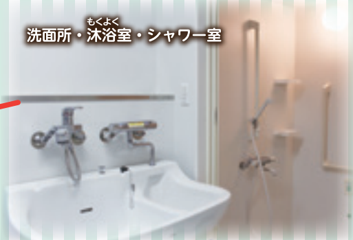
洗面所・もくよく・沐浴室・シャワー室