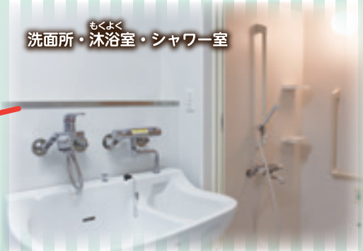
洗面所 もくよく 沐浴室・シャワー室