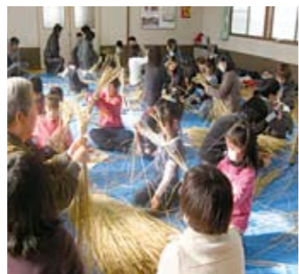
② わら馬づくり(生塚自治会)