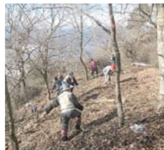
① 虚空蔵山の山城整備(太郎山山系を楽しくつくる会)