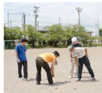
② ペタンク講習会(西部ペタンク同好会)