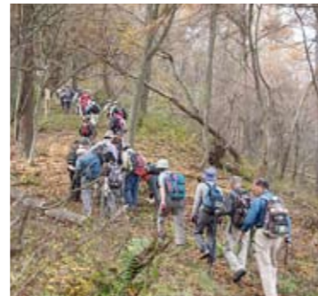
整備された太郎山・虚空蔵山間のトレッキングコースを歩く