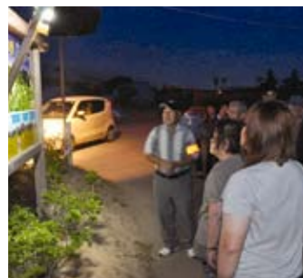
① ホテルの生態や習性を説明(下塩尻自治会)