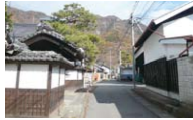
塩尻の蚕室造りの家並み

地域まちづくり方針は、上田市総合計画の一部として、地域協議会の区域ごとに策定し、自然や文化などそれぞれの地域の特色や個性を生かしながら、市民と行政が連携して住みよい地域づくりを進めるための方向を示すものです。内容的には行政活動だけでなく、市民が自主的に進める各種の地域活動や、市民と行政との協働によって実現していくべきものを含めた、地域と行政の共通目標としての性格を持つものです。