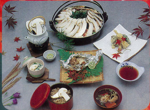
▶写真はイメージです。