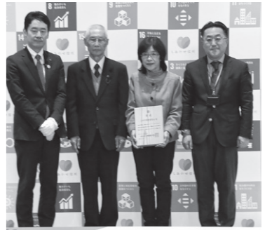
信州SDGsアワード2023 「信州SDGsアワード2023」受賞