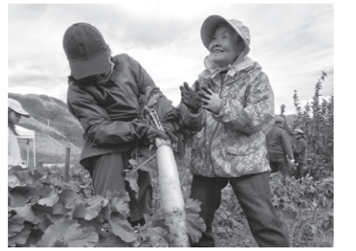
農業体験会の様子