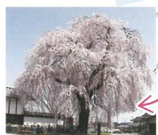
信廣寺のしだれ桜 (4月中旬)

●満開時には、花桃の里入口からマイカー自主規制 (タクシー、身体障害者マーク、高齢運転者標識以外の一般車両の通行をご遠慮させていただいています) ※花桃の里入口にある、「一万歩駐車場」にお車を止めていただき、シャトルバスにお乗り換えいただけます。 (詳しい運行はTEL0268-85-2828へお問い合わせください。)