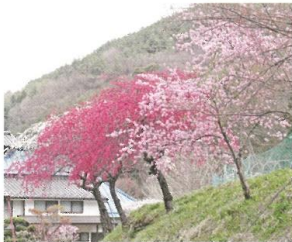
3 Tokinosu Course (0.7km) 余里では、普段の生活を忘れゆつくと花桃を眺められます。