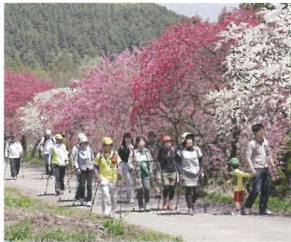
4 宮前コース (0.6km) 赤白の花桃が咲き乱れる“世界中で一番きれいな二週間”は、見る人に感動を与えます。