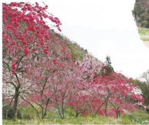
2 中央農道コース (1.2km) 新緑の中から見下ろす花桃は、また違った景色が楽しめます。