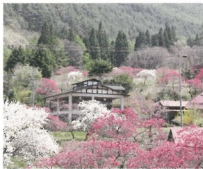
1 Hodogai Course (0.3km) 山畑に咲く花桃を間近に見られます。