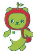
長野県 PR キャラクター「アルクマ」 ©長野県アルクマ

長野県では2019年に「気候非常事態宣言」を発表し、2050ゼロカーボンを目指しています。今回その取り組みの一つとして、太陽光パネルや蓄電池の購入を希望する県民の皆様を募集します。参加が多いほど「よりオトクに」購入できますので、是非ご検討ください。