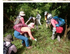
昨年の整備の様子