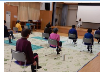
筋力トレーニングの様子