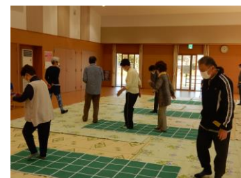
スクエアステップの様子