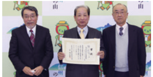
飯沼自治会 里山環境整備プロジェクトチーム

主な活動：森林資源の利活用や防災・減災対策としての環境保全活動などの里山の復活に向けた取り組みなど