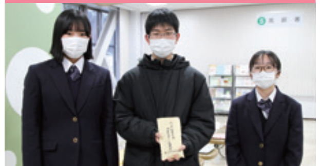
丸子中学校の生徒と義援金

3月7日(木)、丸子中学校の生徒たちが協力して集めた義援金8,893円を丸子地域自治センターに届けました。義援金は丸子地域自治センターを経由して日本赤十字社に渡りました。