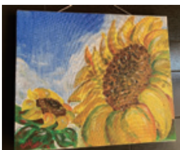
入口に飾つてある絵