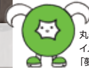
丸子修学館高等学校 イメージキャラクター 「夢見る子ヒツジ」 マルシーブ