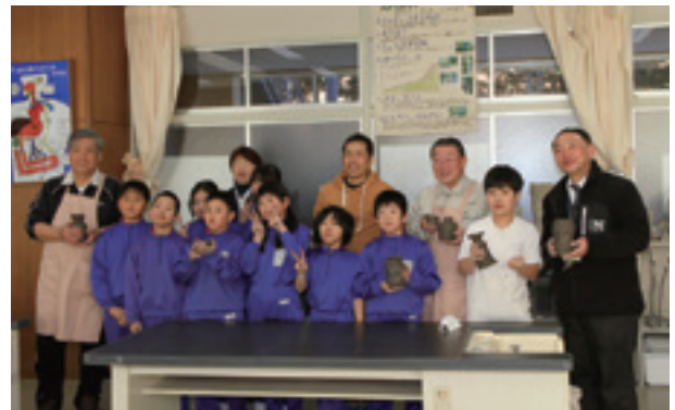
【4年生と市長・教育長など】