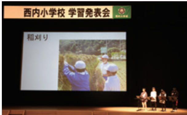
【学習発表(地域自然活動)】

丸子文化会館で開催された学習発表会では、登り窯活動・地域自然活動・金管バンド活動など1年を通して学んだことを発表し、お世話になった講師の先生方、地域の方々に感謝の思いを伝えました。創立150周年にちなんで全校児童で力を合わせて大縄8の字跳び150回にチャレンジし、目標の3分以内に跳ぶことができました。金管バンドによる演奏も行い、最後に全員で「大切なもの」と「校歌」を合唱しました。