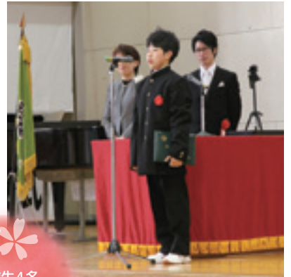
卒業生4名 卒業証書授与式