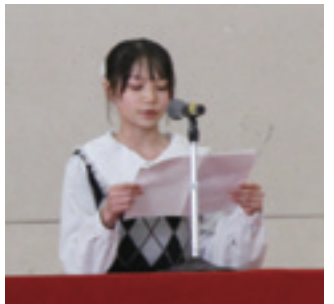
【児童代表のことば(閉校式)】