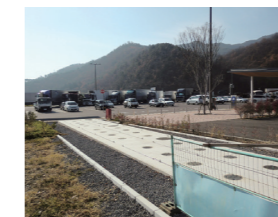
▲ ひと休みする車が多数みられました

現在、平成23年4月のオープンを目指し、周辺の公園整備を実施中（芝生広場・ヘリポート・ドッグラン・ウォーキングコース等）です。