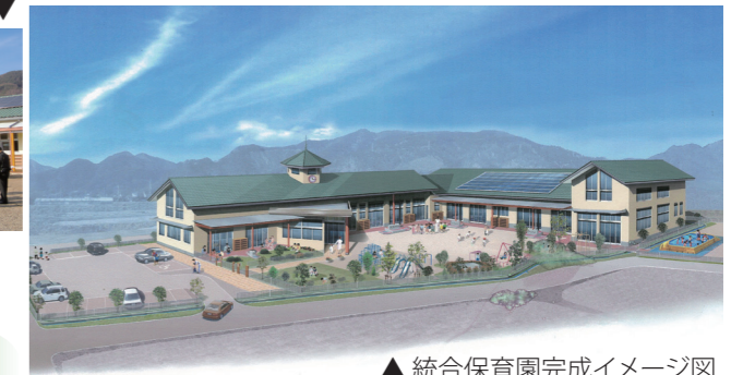
▲ 統合保育園完成イメージ図