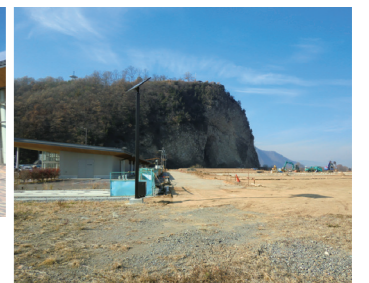
▲ 整備中のヘリポートと公園