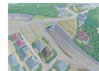
▼ 現在工事が進められています