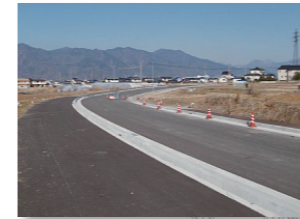
▲ 川辺町国分線の整備状況