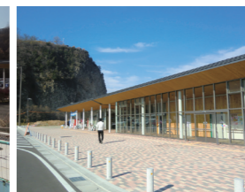
▲ 完成した道と川の駅の施設