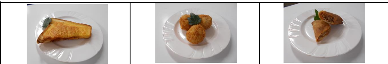
商品名:カレーパン 金額:1袋120円