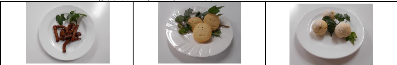
商品名:かりんとう 金額:1袋110円