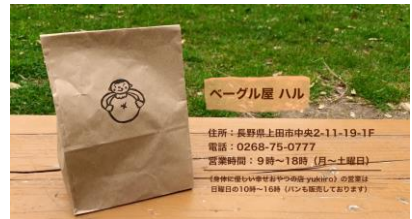
参考動画③ベーグル屋ハル様