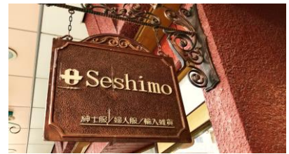
参考動画②セシモ洋服店様