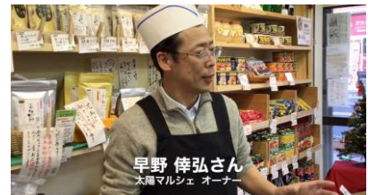
参考動画①太陽マルシェ様