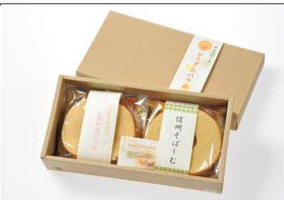
商品名：バウムクーヘンセット 金額：3,000円(送料込) そば～むと季節のバウムのセット