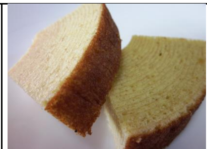
商品名：そば～む(1/8カット) 金額：162円(最低数8個)