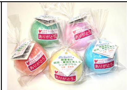
商品名：バスボム(ノベルティ) 金額：250円 オリジナルタグ作成100個～