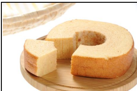
商品名：信州そば～む 金額：1,100円 道の駅売上No.1のお土産菓子