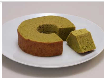
商品名：抹茶そば～む 金額：1,300円