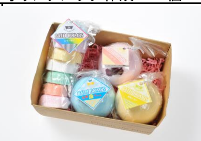
商品名：バスボムギフトセット 金額：1,080円 人気のバスボムをセットで