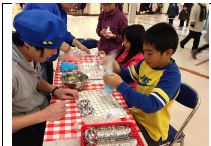
商品名：バスボムワークショップ 金額：50名まで20,000円 出張可、価格は人数により応談