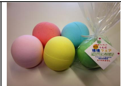
商品名：バスボム(ミニノベルティ) 金額：180円 小さいサイズオリジナルタグ100個～