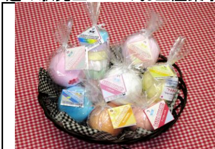
商品名：バスボム(レギュラー) 金額：210円