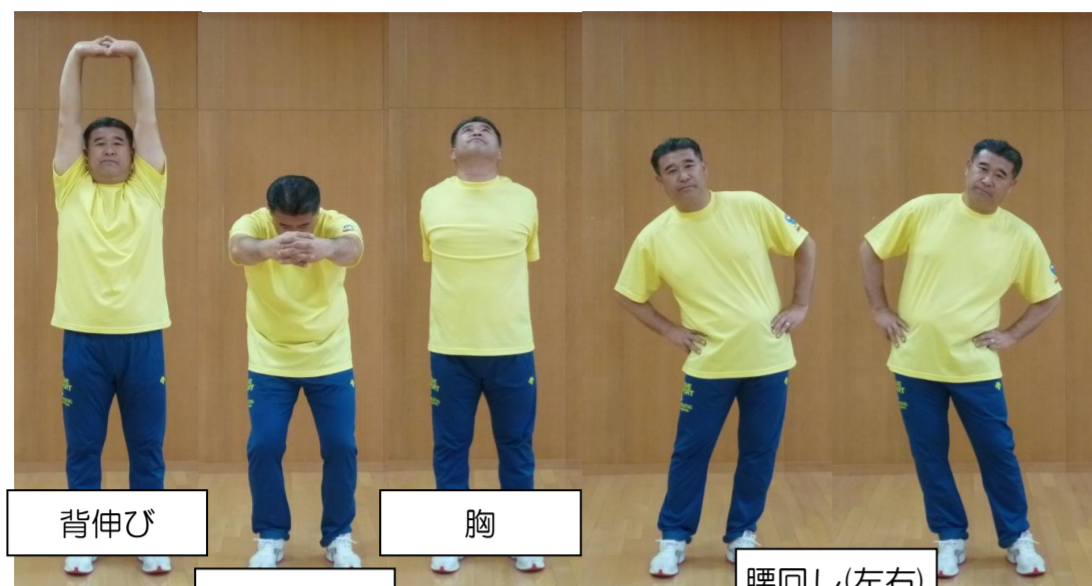
背伸び 背中・腰 胸 腰回し左右