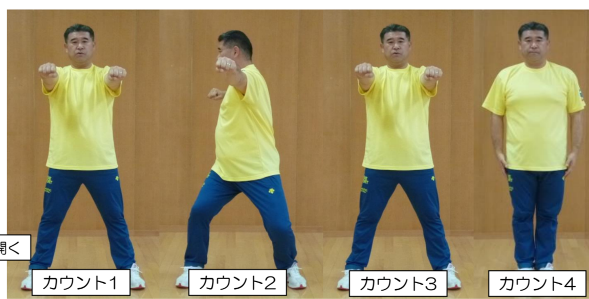
右足開く カウント1 カウント2 カウント3 カウント4

⑤豊かな自然に育(はぐく)まれ 蚕(かいこ)織(お)りなす上田紬(うえだつむぎ)