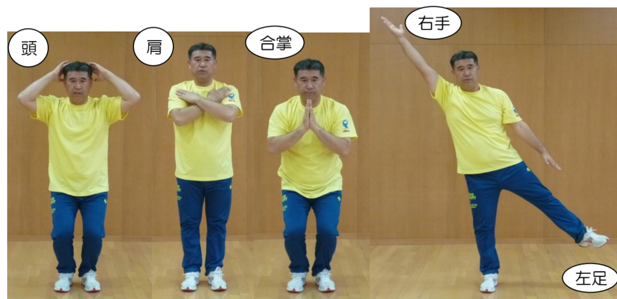
頭 肩 合掌 右手 左足