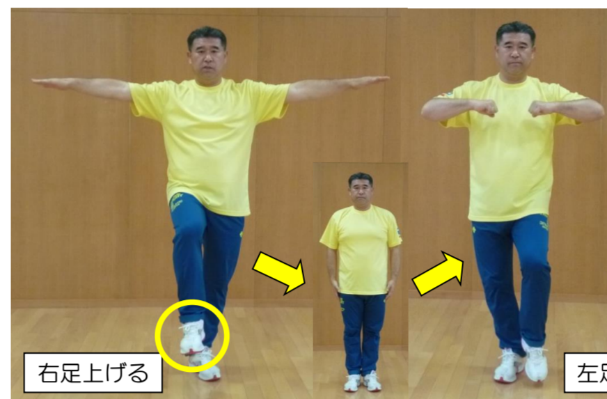
右足上げる 左足から歩く