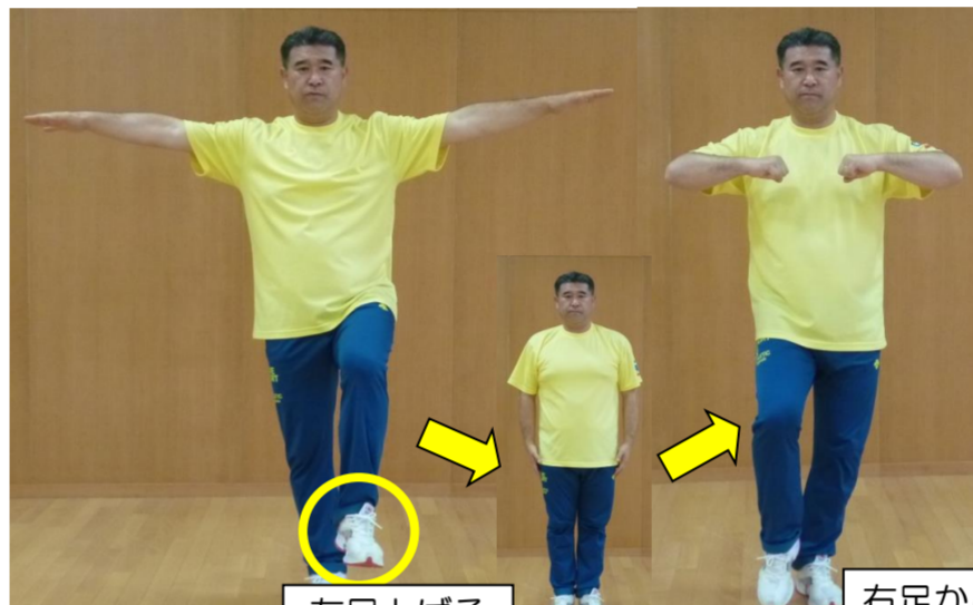
左足上げる 右足から歩く

<バランス> ②両腕を広げながら右ももをあげる。脇でリズムをとりながら、左足から3回足踏みを行う。左足も同様に、右足から3回足踏みを行う。