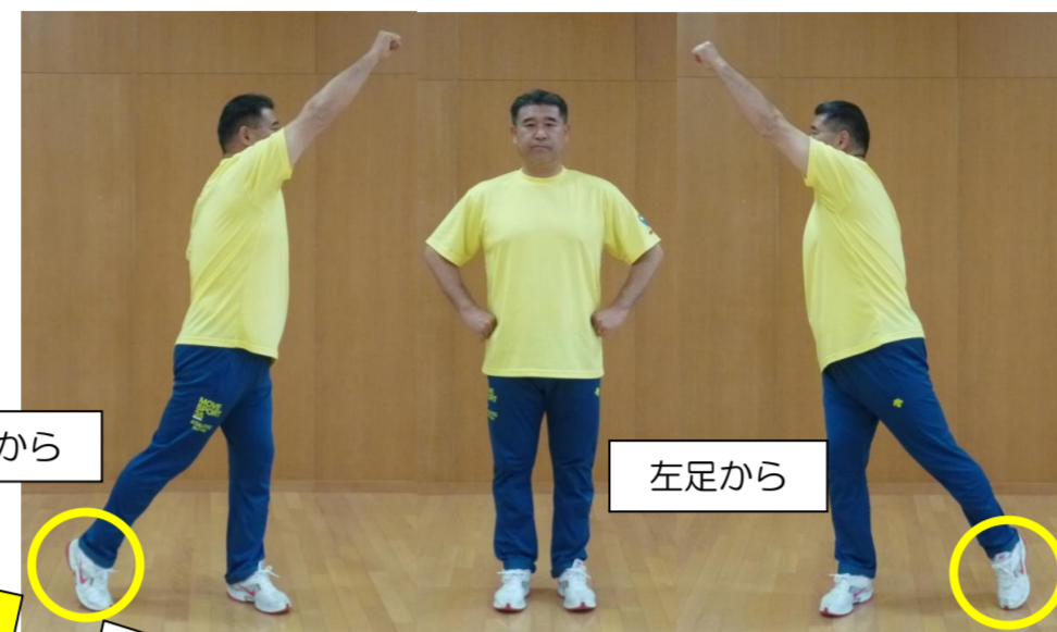
右足から 左足から