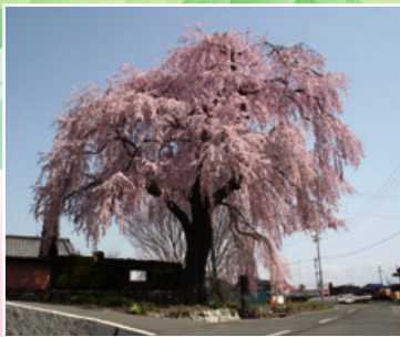
■信廣寺のしだれ桜 (4月下旬)

■満開時 (GW頃) には、花桃の里入口よりマイカー規制 (観光バス、タクシー、身体障害者マーク、もみじマーク以外の一般車両の通行禁止を予定しています。) ※花桃の里内の交通渋滞をなくし、静かな里の宝を排気ガスから守るために実施しています。ご理解とご協力をお願いいたします。武石体育館駐車場にて、無料シャトルバスにお乗り換えいただけます。 ※なお、花桃の苗木の販売は武石体育館で行っています。