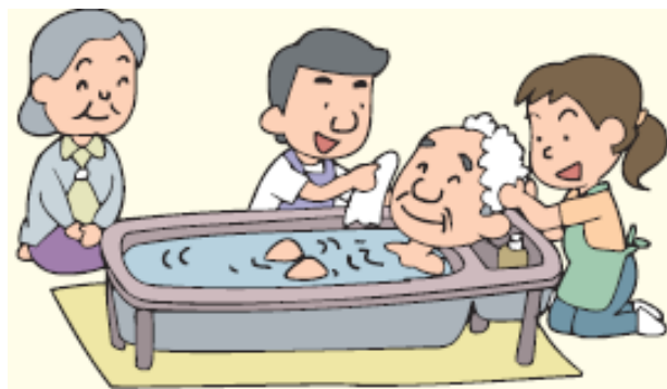
一次自己负担 10% 时大致的金额（円）