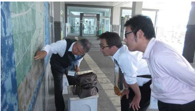
写真は、平和祈念資料館で待ち合わせ後、 出発前の打ち合わせ