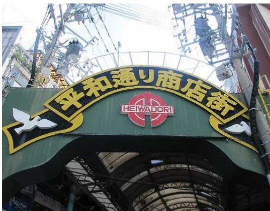
手作り資料で説明するガイドさん