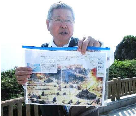
手作り資料で説明するガイドさん