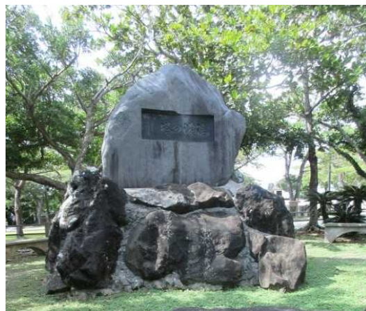
長野県の戦没者の碑