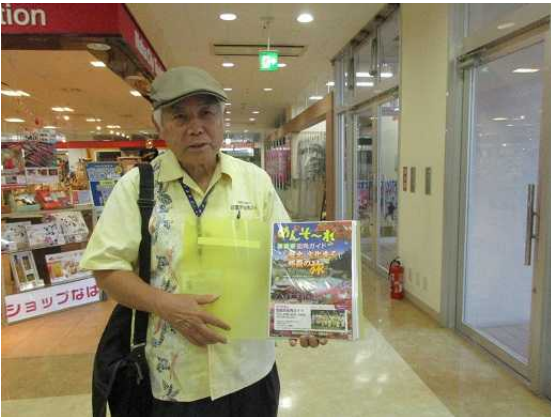
写真は、待ち合わせ場所で初顔合わせ