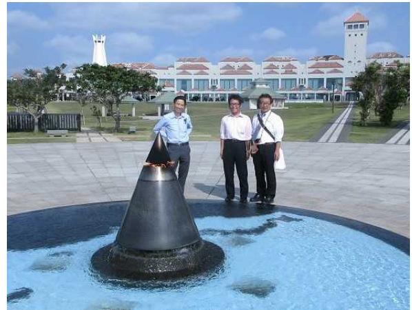
公園の中央にある平和の火(後ろの建物は 沖縄県平和祈念資料館)