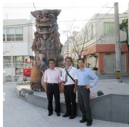
長野県の戦没者の碑