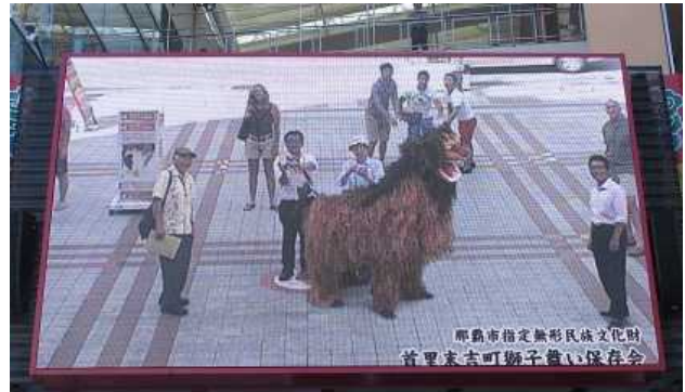
広場には、自動で映像がでる仕掛けがあります。みなさんが喜んでいました。