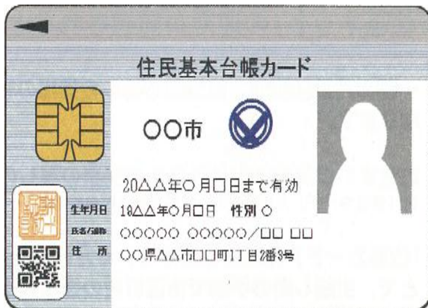
上图为附带照片的住民基本台帐卡

住民基本台帐卡指的是，安全防范方面很好的IC卡，“附带照片的住民基本台帐卡”还可作为身份证明使用。