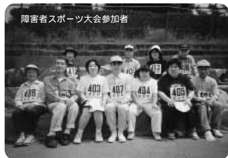
障害者スポーツ大会参加者

五月二十七日、理事・評議員会が開催され、平成十五年度事業報告並びに決算が認定・承認されました。 法人運営事業、福祉の村づくり事業、共同募金配分金事業、受託事業、指定通所介護事業の五事業会計総額で、収入一億三千八百八十八万円、支出一億二千九百七十九万円となり、差引当期収支差額が九百九十九万円のプラスとなりました。この中にはマイクロパスなどの車両購入費に充てられたため千六百万円の取崩収入が含まれています。 予算の比重の大きい指定通所介護事業では利用者が年間九千七百九十四人と昨年の七千八百