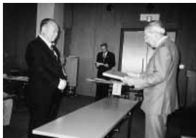
緑の基金の緑化功労表彰式

この会は平成三年に結成され、余里地区を花桃で明るくしようと活動を始め、地元の樹齢百年の木から種取りをして、苗木を植栽してきました。現在では地区内の道路におよそ千本の木が植えられており、毎年五月には白や赤などの花桃が咲き、訪れる人たちの目を楽ませてくれます。