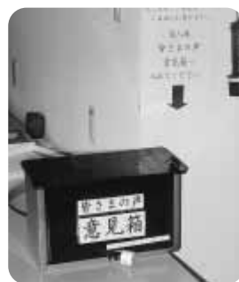
皆さまの声意見箱

この大会には、上田市、東御市、小泉郡の障害者と福祉施設入所者などが参加し、スポーツを通じて親睦を図り、社会活動への参加と地域の皆さまの障害者に対する理解と認識を深めていただくことを目的に開かれている大会です。