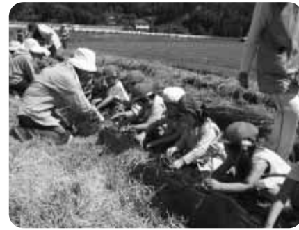
はやく大きくなるかな?

六月四日、保育園では生活改善グループのみなさんに準備していただいた「おつまいも」の苗を近くの畑に植えました。苗を手にした園児達は、「これからおつまいもができるの?」「苗にワラのおふとんかけてあげよう?」などと先生と話をしながら楽しそうに笑顔で作業していました。また、植え終えた苗の根本に小さなバケツで水くれもしました。 秋には園児たちが、大きく成長したおつまいもを収穫して美味しく味わう予定です。