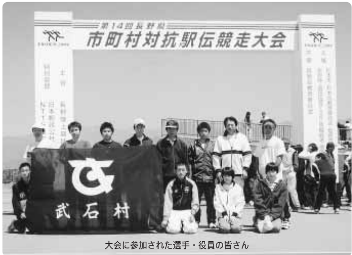
大会に参加された選手・役員の方々

四月二十九日、松本平広域公園陸上競技場で第十四回長野県市町村対抗駅伝競走大会が行われました。参加チームは七十四チームで四一・一九五キロメートル、八区間で競走し、武石村の代表チームは総合タイム二時間三十分四十四秒の三十四位でゴールテープを切る事ができました。