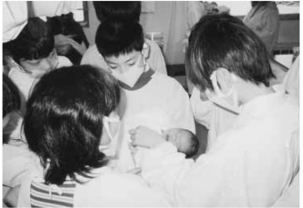
「赤ちゃんて、かわいいね」

教育委員会の動き ■10月定例会 10月10日(火) 開催した10月定例会の主な内容は、次のとおりです。 審議事項 社会教育委員の公募について 現在欠員となっている1人の委員を公募により選出する件について審議し、承認されました。