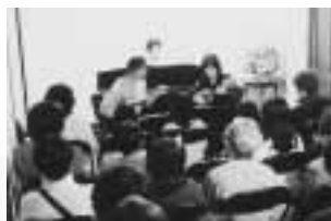
▲マンドリン演奏会