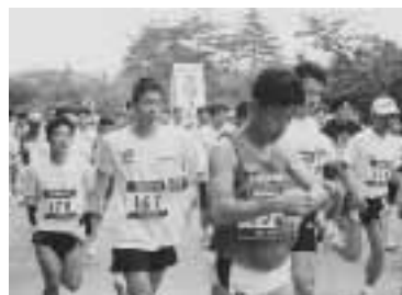
力いっぱい走りました