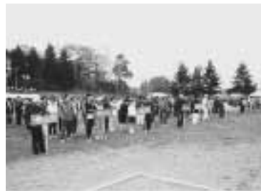
参加者のみなさん