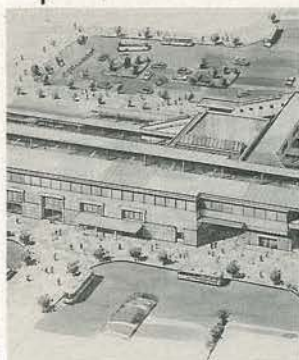
橋上駅舎整備の負担金を計上