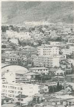
地方振興の拠点づくりを

市町村別にみると、人口が減少した市町村の数は五年前四八%だったものが六四%に急増しています。