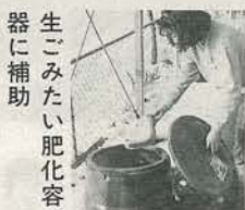
生ごみたい肥化容器に補助