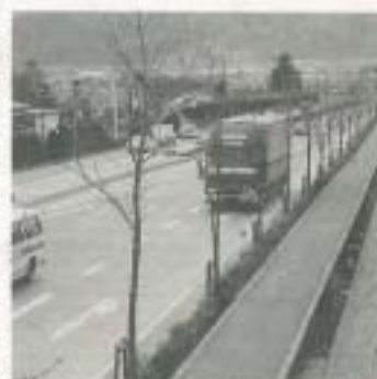
道路はみんなの財産です

自転車などを置かない」など、道路を常に広く、美しく、安全に利用するためにご協力をお願いします。 ▽問い合わせ 管理課(☎1507)