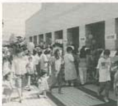
美しい企画がいっぱい

● ● ● 持つ皆さんや障害者福祉に取り組み多くの団体の皆さんによる、いろいろな企画がいっぱいあります。詳しくは、8月22日朝刊折り込みチラシをご覧ください。