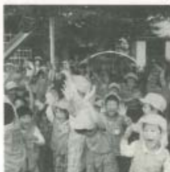
現況届の提出を忘れずに

び特別児童扶養手当の現況届を 住所地に提出することが義務付 けられています。手当を受けて いる人は、今年度「現況届」を 提出してください。提出がない 場合は、8月分以降の手当を受 けられなくなる場合もあります のでご注意ください。 ▽提出期限 8月30日(金) 3 提出先 福祉課(南庁舎1階・ 内1608)