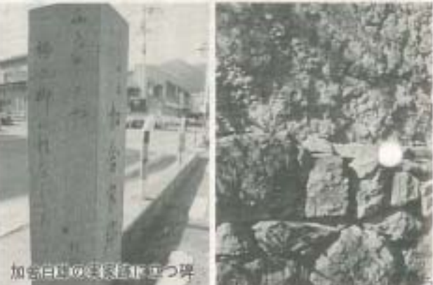
加吉白草の実家跡に立つ碑