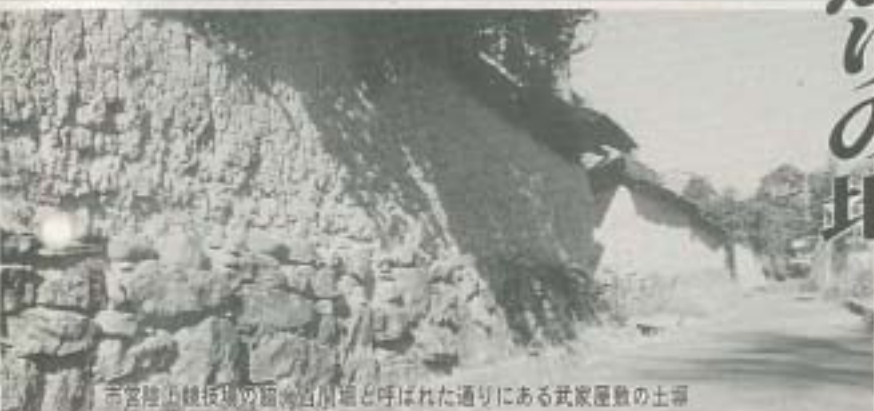
市宮陸上競技場の西側、加舎とと呼ばれた通りにある武家屋敷の土塚

北大手は、その名が示すように、上田城の北側に位置する町で、江戸時代は侍たちが住んでおりました。その武家屋敷のなかに130石取りの加舎家がありました。有名な俳人加舎白雄の実家です。そのことを記念して、平成2年、中央西一丁目7の歩道脇に「俳人白雄ゆかりの加舎家跡」の石碑が建立され、「ふる