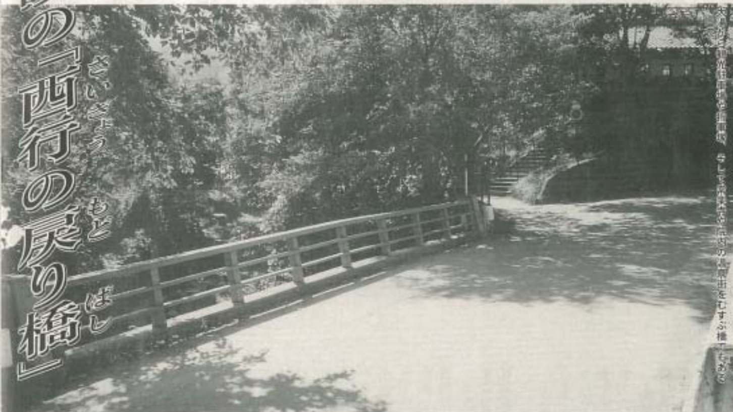
別所温泉相染橋(湯川)をむすぶ橋(もゑの橋)