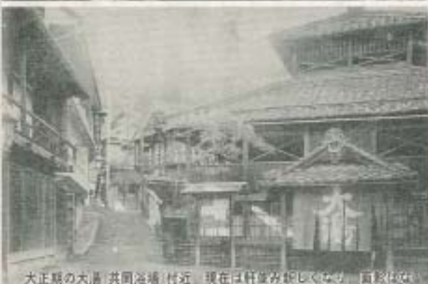
大正期の大湯(共同浴場)付近。現在は軒並み新しくなり、白壁の町