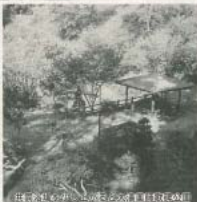
供養塔のそばに立つると大湯川は泉の川