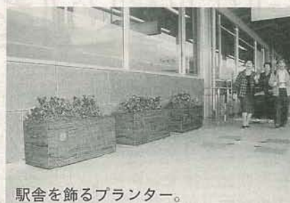
駅舎を飾るプランター。