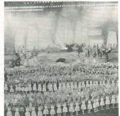
国際ファッションフェスティバルのオープニングセレモニー

寧波市：上海の南170キロメートルに位置し、平均気温16℃。人口は約530万人で、総面積9365平方キロメートル。 古くから対外貿易の重要な港であり、遣唐使が発着した地として、日本文化の形成に大きな役割を果たしてきた。現在は、寧波経済技術開発区を中心に中国最大の開発区の一つとして発展を続けている。