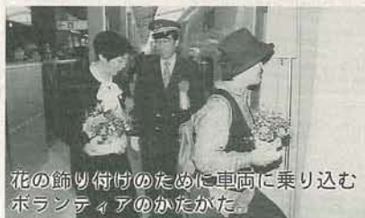
花の飾り付けのために車両に乗り込むボランティアのかたがた。