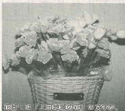
花器には「上田地域の花」の文字が。