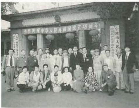
寧波市役所も訪問

今回で3回目になる市民訪中団は、10月4日に寧波に到着。翌日は、別所温泉の安楽寺の開祖・樵谷惟仙禅師も修行した「天童寺」や、揚子江以南で最古の木造建築物「保国寺」、30万トン級の超大型貨物船も接岸できる「北侖港」などを見学しました。そして6日には、寧波市で初めて開催された「第1回国際ファッションフェスティバル」に参加。寧波体育場（陸上競技場）いっぱいに繰り広げられた華やかなオープニングセレモニーを堪能しました。 訪中団は、その後重慶・武漢・上海などを訪問し、10月13日に帰国しました。