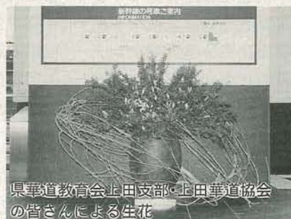
県華道教育会上田支部・上田華道協会の皆さんによる生花