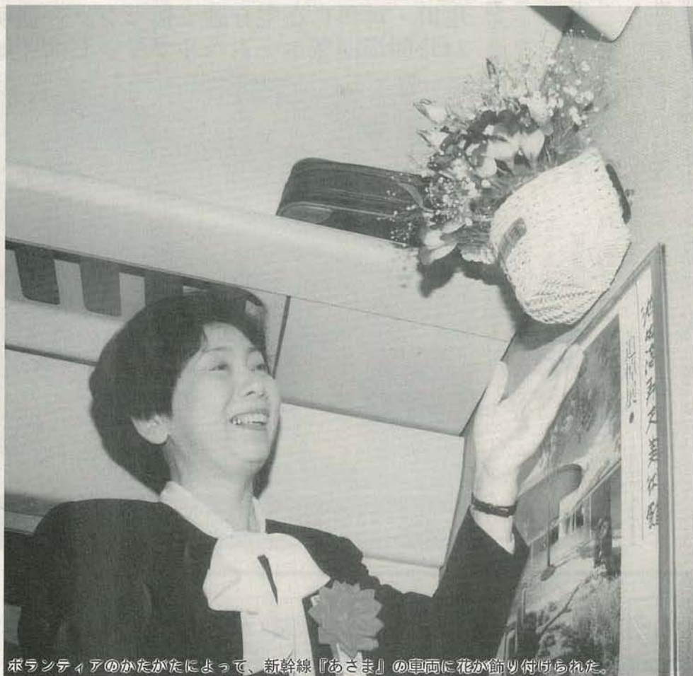
ボランティアのかたがたによって、新幹線『あさま』の車両に花が飾り付けられた。