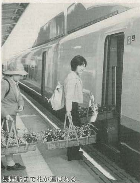
長野駅まで花が運ばれる。