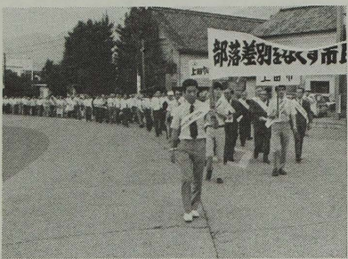
昨年行われた市民大行動

るとともに、部落の完全解放を図りましょう。 〈とき・ところ〉 七月二十二日(金)午後三時から、上田市民会館(上田公園内) 〈日 程〉 開会宣言、主催者代表あいさつ 来賓祝辞、議長選出。スローガンの確認。意見発表。宣言決議。閉会。市民大行動。 〈大行動(市内行進)〉 コース①②の丸橋―市役所前 中央交差点―原町―旧九二交差点で流れ解散。 コース②③の丸橋―市役所前 中央交差点―海野町―旧上田東駅で流れ解散。 コース③④の丸橋―市役所前 中央交差点―松尾町―鷹匠町交差点で流れ解散。 終了時間―午後五時の予定。雨天でも実施します。