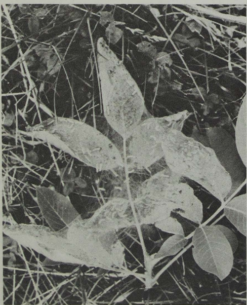
このクモの巣状のとき、一網打尽に

今、アメリカシロヒトリが各地域で発生しています。各撲滅班はもとより、自分の樹木をよく見回り、一匹残らず退治しましょう。