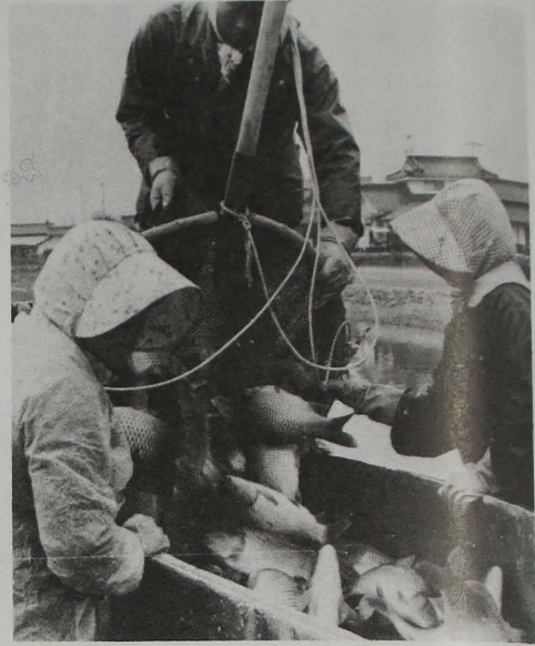
上田の特産品「塩田ゴイ」を守ろうと、12月市議会で補助を決定