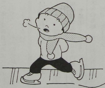
乳幼児健康診査日程表

人員：三十五名(定員になり次第締め切ります) 申込先・締め切り：一月二十四日(土)までに、上小高等職業訓練校へ申し込んでください。