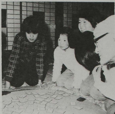
諏訪部地区では、1月6日、日本の代表的な遊び「百人一首を楽しむ会」が開かれ、この会は、昨年に続き今年が二回目。会場の諏訪部公民館には中学生から70代のお年寄りまで、20名近い愛好家が集まり、夕食後のひとときを楽しみました。