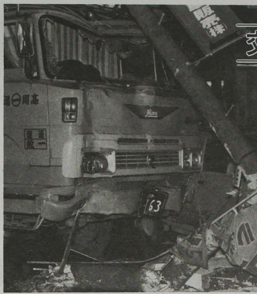
ハンドルを握ったら安全運転を忘れずに

上田市は、昭和五十六年中に市内で発生する交通事故による死亡者を「五人以内」に、くい止めようと、このほどその抑止目標を決めました。