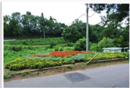
最優秀賞 真田中学校