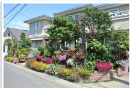
最優秀賞 中島様 宅