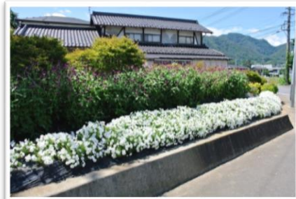
優秀賞 下丸子福寿会