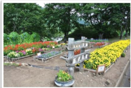
最優秀賞 大畑自治会花づくり推進部