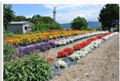
最優秀賞 尾野山長寿会