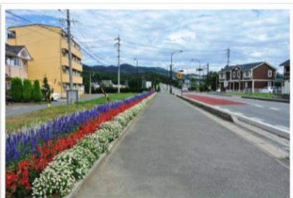
優秀賞 下本郷地区花と緑の街づくり協議会