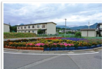
奨励賞 保野長生会