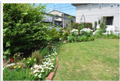
優秀賞 滝沢様 宅