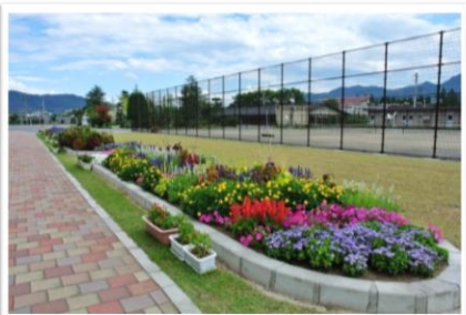
優秀賞 塩田中学校