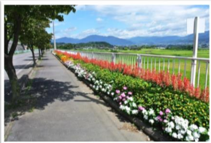
優秀賞 上平南自治会