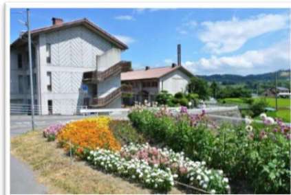
奨励賞 丸子北中学校 3年2組 大学花作り学科

平成28年度は新生上田市が誕生して満10周年を迎えたのと同じく、10回目の開催となりました。