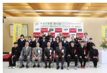
丸子北中学校の皆様