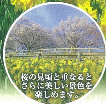
桜の見頃と重なるとさらに美しい景色を楽しめます。