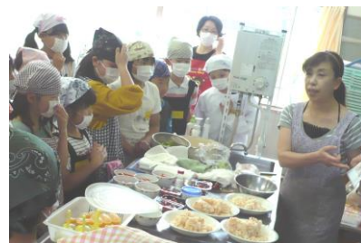
→ 川辺小 料理クラブ