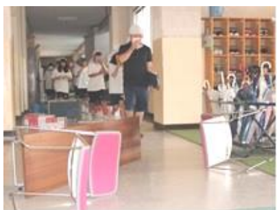
← 四中 避難訓練