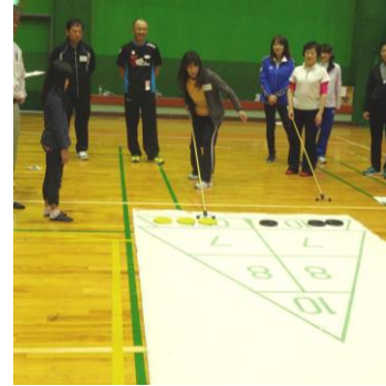
シャッフルボード