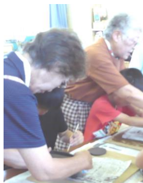
↑ 南小 陶芸活動