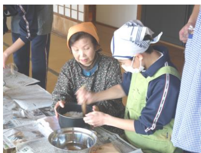
→ 六中 ふるさとタイム