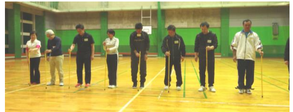
キャッチング・ザ・スティック