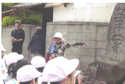
← 城下小 地域探検