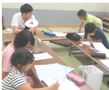
→レクリエーションをして 遊びました。