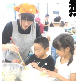
←春まきを作りました。