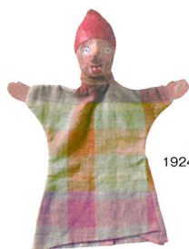
《ギニョール》 1924(大正13)年