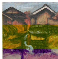
《第1回児童自由画展覧会入選作品》 1919(大正8)年