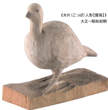
《木片(こっば)人形【雷鳥】》 大正～昭和初期

1919(大正8)年、版画家・洋画家として知られる山本鼎(1882-1946)が始めた「農民美術運動」と「児童自由画教育運動」。農民の手工芸品として始まった「農民美術」の生産は、大正から昭和初期にかけて一時全国に広がりました。現在は、長野県上田地域の伝統的工芸品として定着し、白馬・大町など県内各地にも影響を及ぼしました。一方、正確な模写を評価する大正期の学校教育を打破し、子どもたちの創造性に着目した「自由画」の理念も、今日の図工美術教育の基礎として受け継がれています。本展は、100年を迎えた両運動の果たした意義を見つめ直し、今後の可能性を探ります。