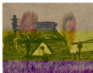
《第1回児童自由画展覧会入選作品》 1919(大正8)年