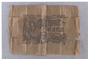
《農民美術包装紙》大正時代