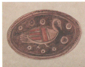
《農民美術デザイン画》1923(大正12)年頃