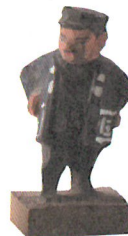
《木片(こっば)人形【人物】》 大正～昭和初期