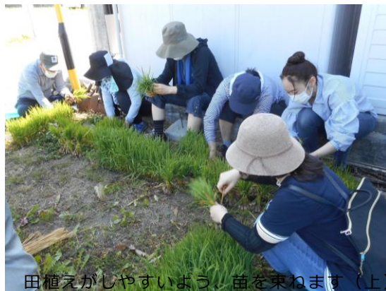
田植がしやすいよう、苗を束ねます(上)