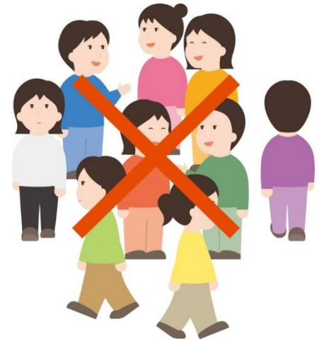
有很多人聚会的密集场所