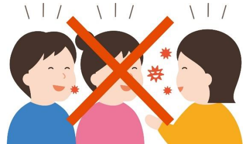
近距离讲话、发声的密切接触