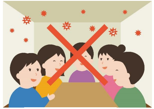
换气不良的密闭空间