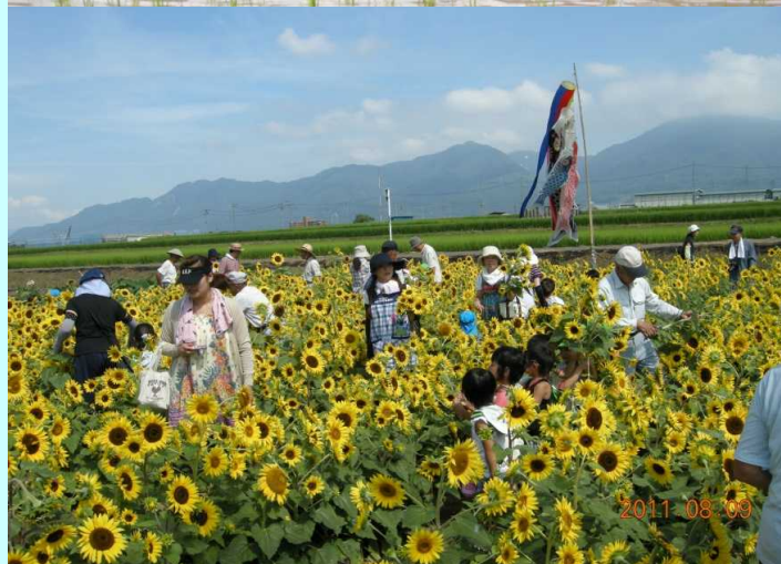
あいがもの放鳥、ひまわり交流会

休耕田を活用してひまわりを栽培してきました。地域のおじいさん、おばあさん、国分保育園の園児の皆さんに自由に摘み取って頂き、家に持ち帰って飾っていただきます。