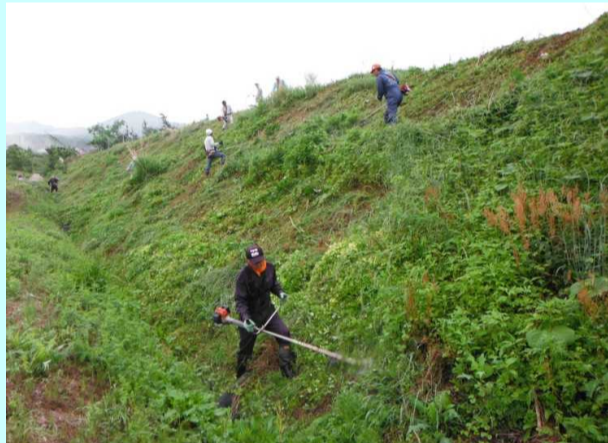
水路の大きな法面の草刈りを行い、きれいにしています。