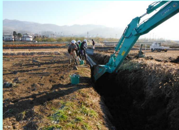
構成員の手により、老朽化した水路の補修工事を行っています。