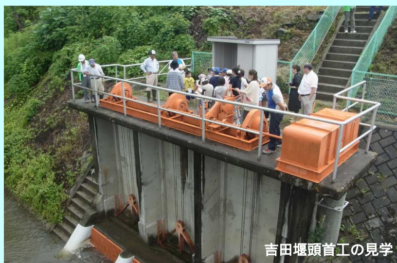
吉田堰頭首工の見学

私たちの使っている水がどこから流れてきているのか、豊殿小学校の子供たちに見てもらうため、神川上流の「菅平ダム」や「吉田堰」を見学して勉強会を行いました。