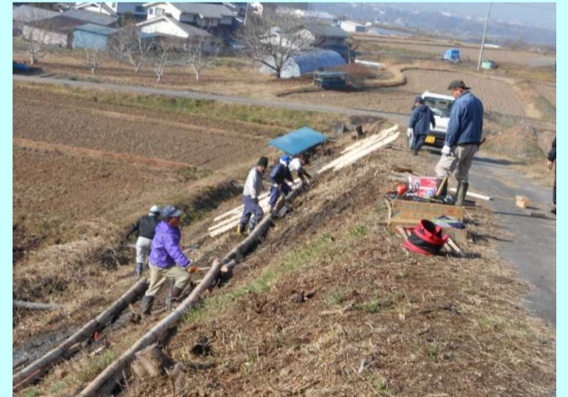
草刈りを容易にするため、畦畔に小段を設置しています。