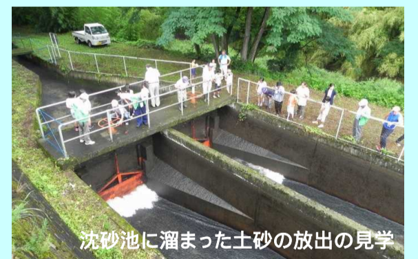
沈砂池に溜まった土砂の放出の見学