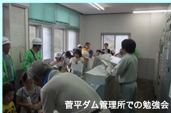
菅平ダム管理所での勉強会