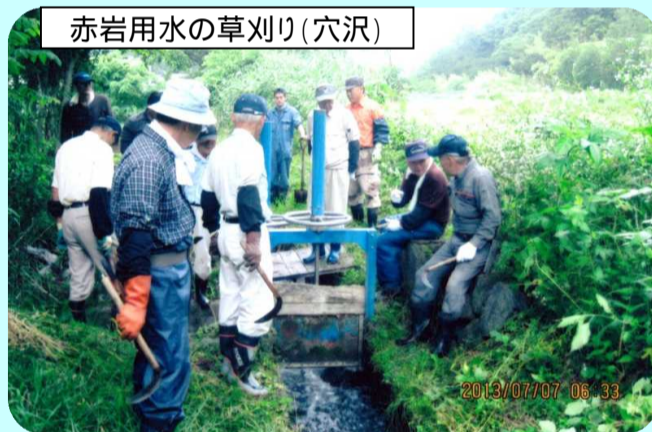
赤岩用水の草刈り(穴沢)