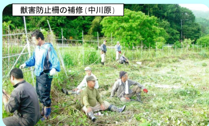
獣害防止柵の補修(中川原)