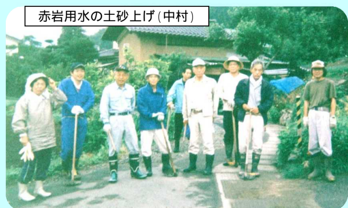
赤岩用水の土砂上げ(中村)