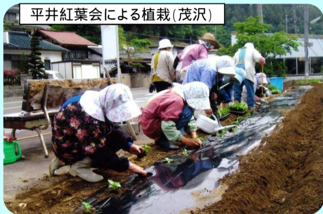
平井紅葉会による植栽(茂沢)