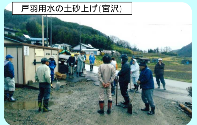
戸羽用水の土砂上げ(宮沢)