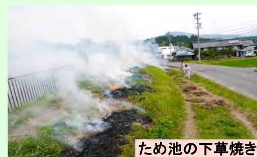
ため池の下草焼き