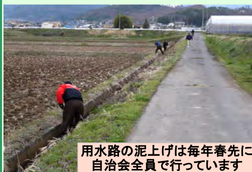
用水路の泥上げは毎年春先に自治会全員で行っています