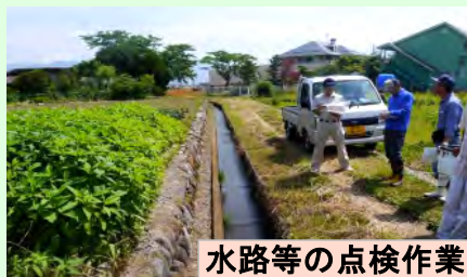
水路等の点検作業