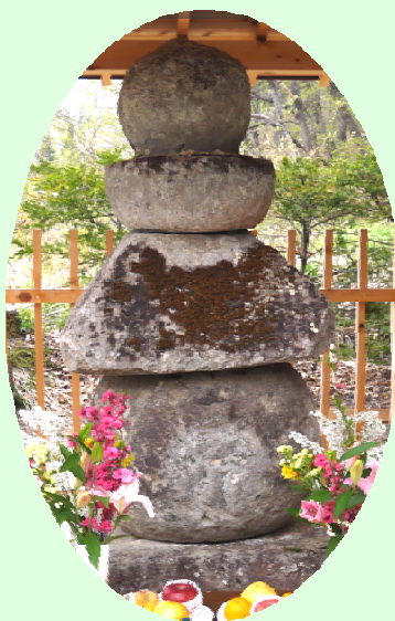
県宝石造金王五輪塔