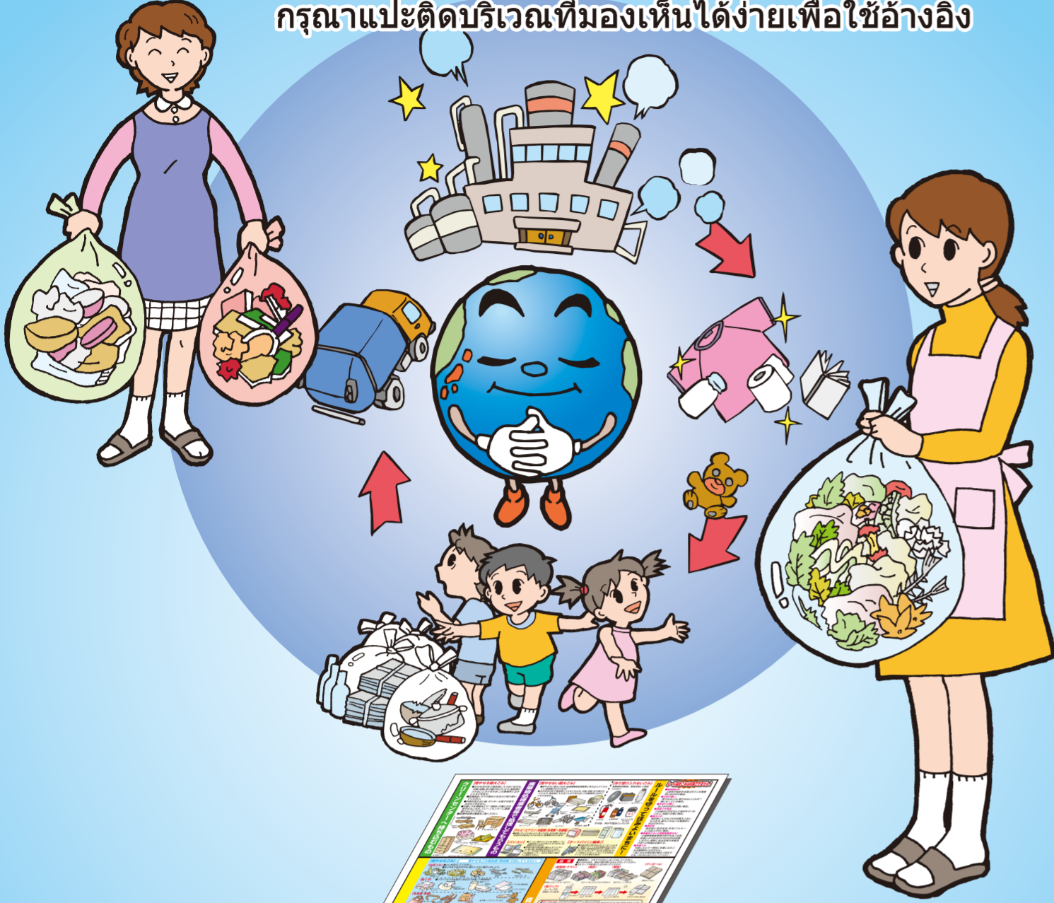
กรุณาติดตรงบริเวณนี้ เช่น ติดด้วยเทป

กรุณาแปะติดบริเวณที่มองเห็นได้ง่ายเพื่อใช้อ้างอิง