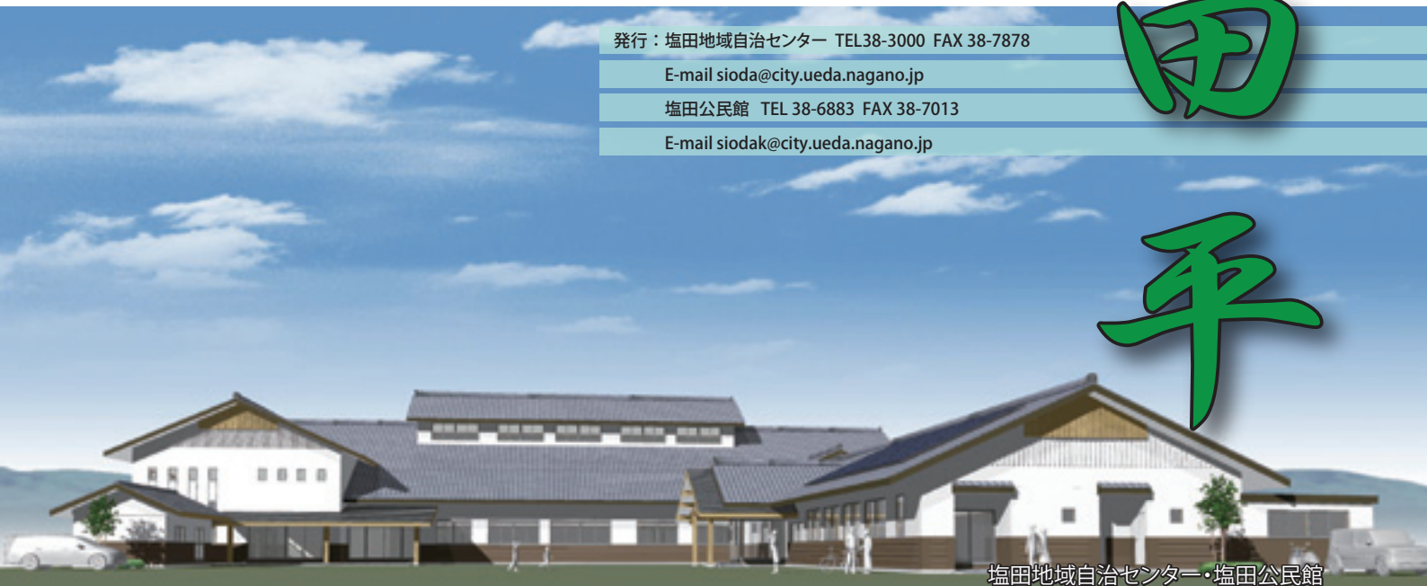
塩田地域自治センター・塩田公民館

ご要望に応じて、「塩田公民館だより」と「塩田地域協議会だより」がひとつになりました。