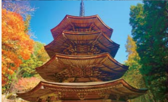
安楽寺八角三重塔