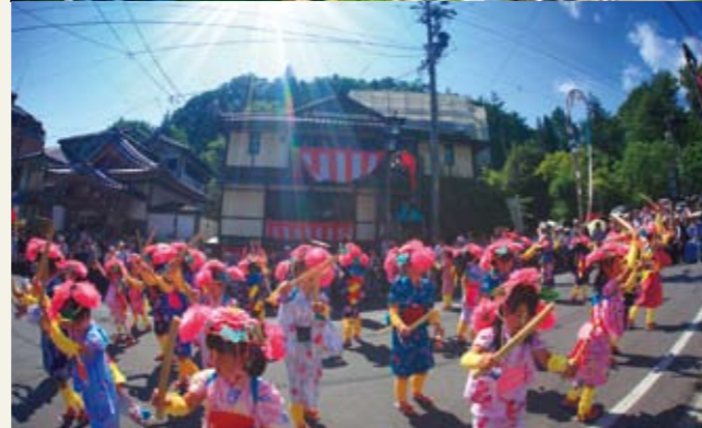
ささら踊り(岳の幟)