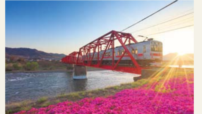
別所線の千曲川橋梁