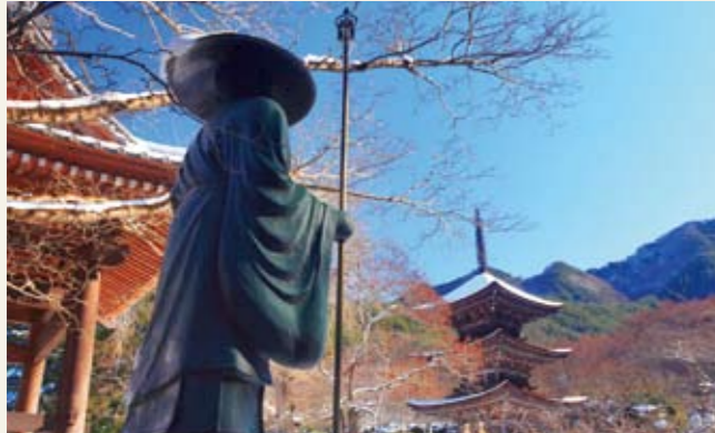
弘法大師ゆかりの前山寺

日本遺産とは、文化庁が認定した、地域の歴史的的魅力や特色を通じて日本の文化・伝統を語るストーリーであり、各地域の魅力あふれる有形・無形の文化財群を、地域が主体となって整備活用し、国内外へ発信することで地域活性化を図るものです。(全国104件、県内4件認定)