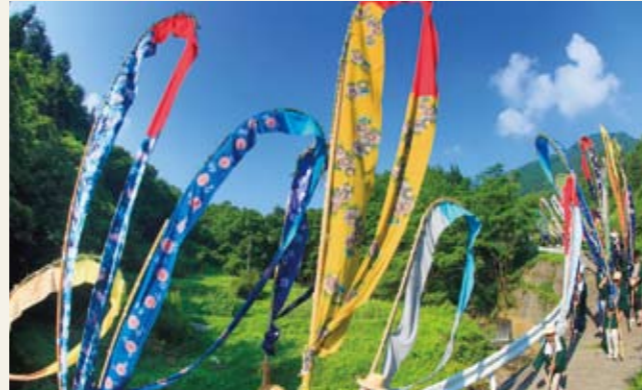
別所温泉の岳の幟行事