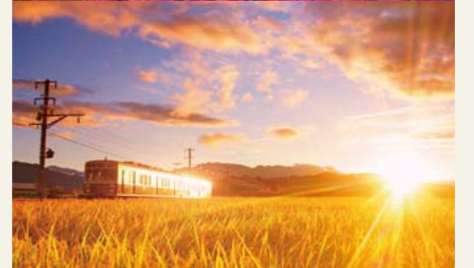
レイラインに沿って走る別所線