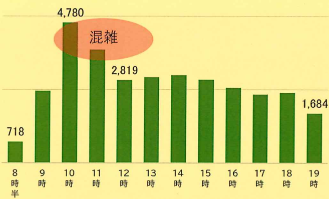
【期日前投票】 1日の「時間別」の投票者数

最終日に近くなるほど、混み合うことが予想されますので、混雑回避のためにも、投票は早めにお済ませください。