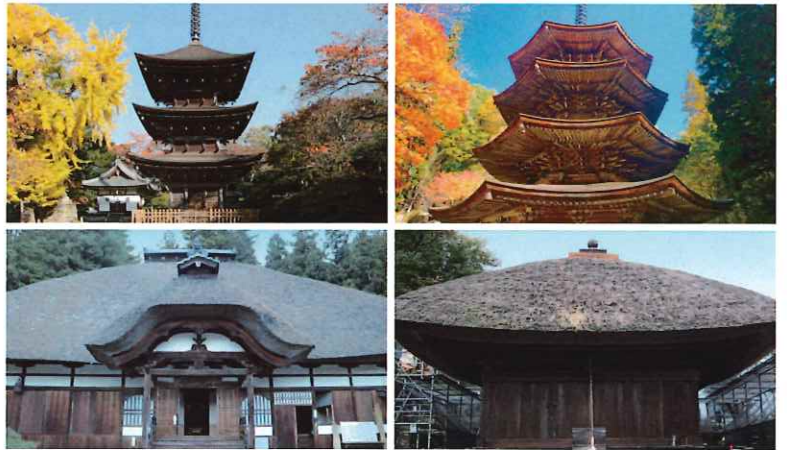
前山寺三重塔 / 安楽寺八角三重塔 / 常楽寺 / 中禅寺