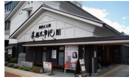
C 池波正太郎真田太平記館