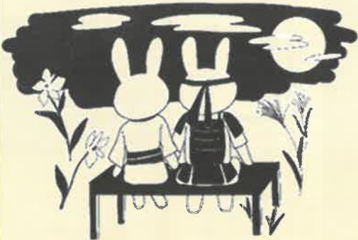
義仲うさぎと巴うさぎ