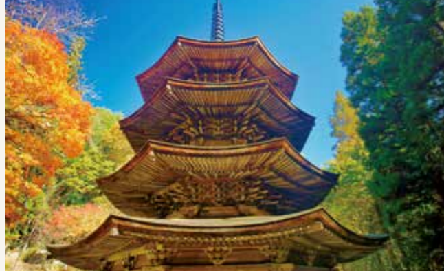
安楽寺八角三重塔