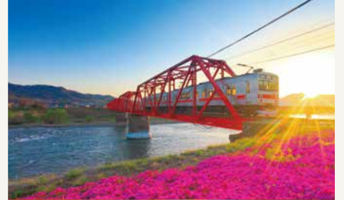
別所線の千曲川橋梁

のぼる太陽から伸びる光は、別所温泉まで続くレイラインと なってこの地の要所を繋ぎます。 その光の波は、塩田平に点在するため池の水面や水田の緑豊 かな稲穂を表し、ついには地域に伝わる龍となって上田の 人々の あゆみ と 折りの形 を表現しています。