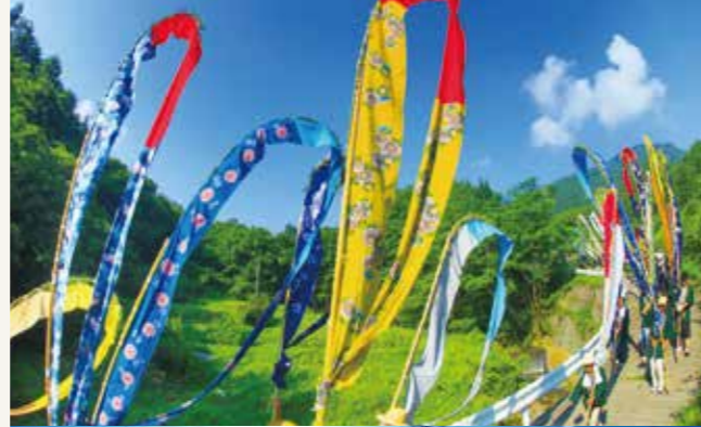
別所温泉の岳の幟行事