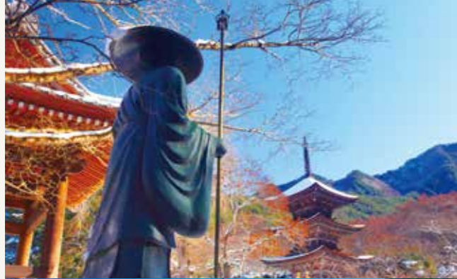
弘法大師ゆかりの前山寺