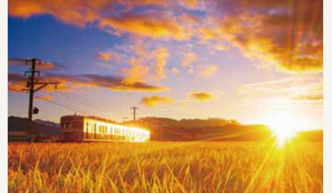
レイラインに沿って走る別所線