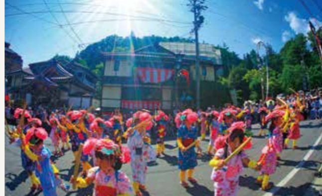
ささら踊り(岳の幟)