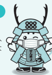
上田市選挙啓発 マスコット キャラクター 真田三代 めいすいくん