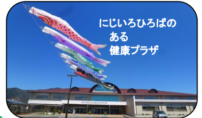
にじいろひろば ある 健康プラザ