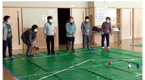
昨年の教室の様子