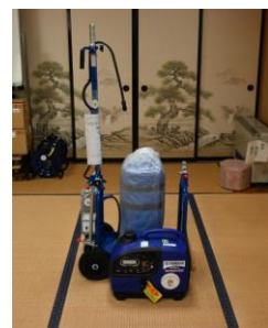
バルーン投光器・発電機:1台