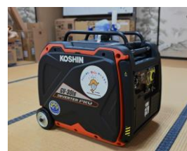
インバーター発電機:1台

公益財団法人長野県市町村振興協会では、市町村振興宝くじ(サマージャンボ等)の収益金を財源に「地域活動助成事業」を行っています。この事業は、宝くじの普及広報を行うこと、コミュニティの健全な発展を図ることを目的に、自治会等のコミュニティ活動に必要な設備の整備に助成をしています。