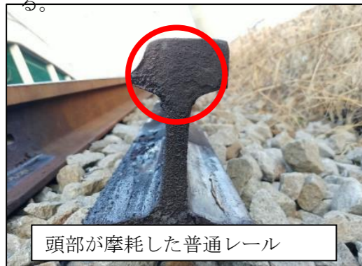
頭部が摩耗した普通レール