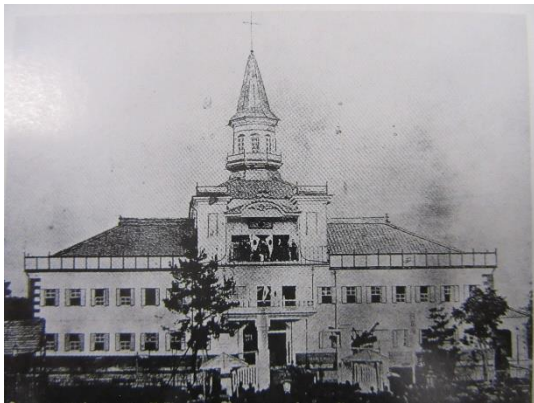
明治11年に完成した上田街学校